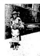
Diawyczka w Chis, która odwróciła głowę od nas.

Rumunia jest miła. Słowo to zawierać powinno w znaczeniu swym, jeśli chodzi o Rumunię, przede wszystkim wdzięk, lekkość, wesołość... Jeśli w Szwecji uderza odraz wykwint