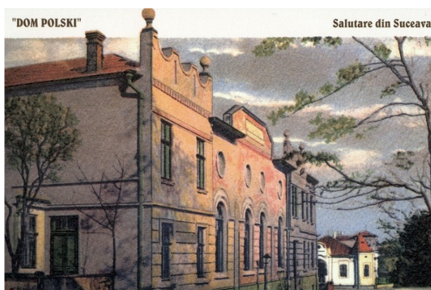
Dom Polski w Suczawie