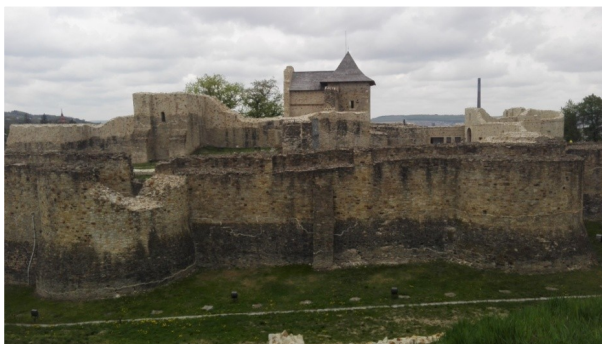
Twierdza w Suczawie, którą próbował zdobyć Jan I Olbracht

Niestety oblężenie Suczawy nie powiodło się, a wyprawa 40 tysięcznej armii pospolitego ruszenia zakończyła się wielkimi stratami polskich wojsk w bitwie pod Koźminem . Straty były tak dotkliwe, że od tego czasu klęskę tę na wieki utrwaliło mocno przesadzone powiedzenie: Za króla Olbrachta wyginęła szlachta .