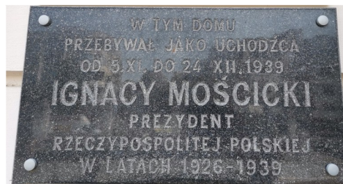
Tablica upamiętniająca internowanie Prezydenta Mościckiego w Craiovie

Na terenie Rumunii zatrzymany został również prezydent Ignacy Mościcki . Miejsca, w których był internowany to między innymi Bicz oraz Craiova. Udało mu się jednakże wyjechać do Szwajcarii. Było to już 25 grudnia 1939 r. Inni spróbowali uciec i to z pozytywnym skutkiem. Tak było w przypadku Edwarda Śmigłego Rydza, Felicjana Sławoja Składkowskiego, Witolda Grabowskiego, Mariana Zyndrama-Kościałkowskiego, Juliusza Poniatowskiego czy Mchała Grażyńskiego.