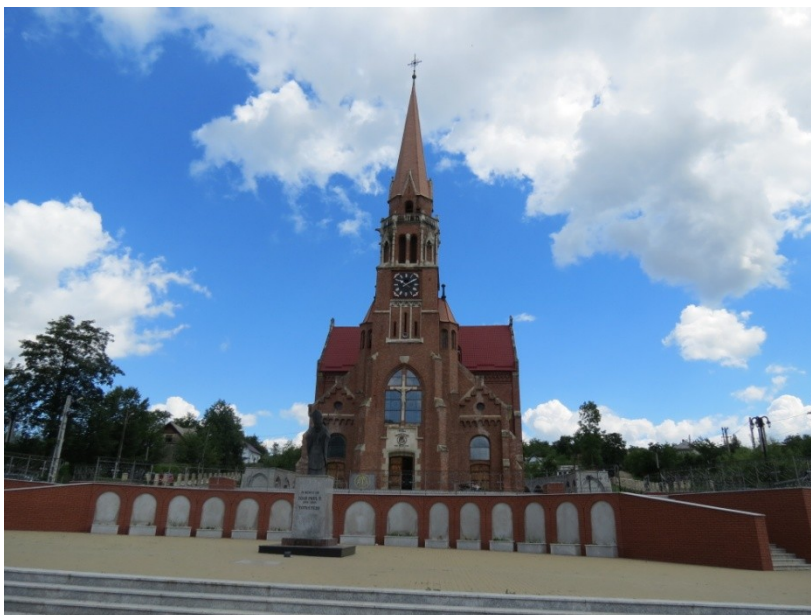
Kościół w Kaczyce

Nowego Sącza. A więc tereny Małopolski i Podkarpacia.