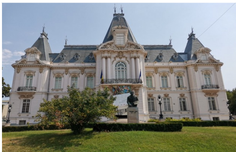
Miejsce internowania Prezydenta Ignacego Mościckiego w Craiovie